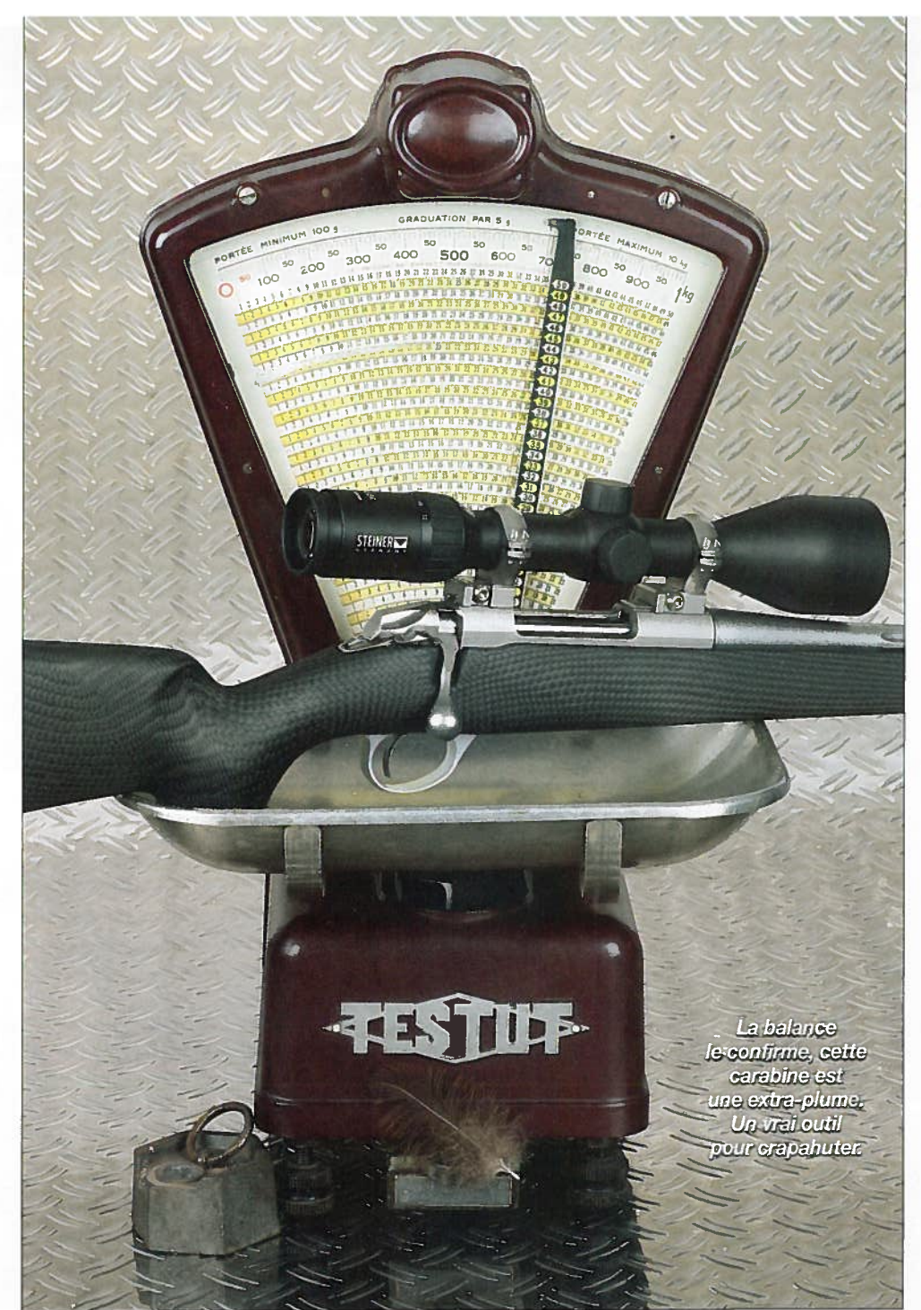
La balance le confirme, cette carabine est une extra-plume. Un vrai outil pour crapahuter.

La relime de cette crosse est assez conventionnelle et typée Sako. Outre la poignée pistolet, ergonomique donc, on trouve un busc droit, une joue ronde et un devant court fini en biseau. Une épaisse plaque de couche absorbante, noire et pleine de 25 mm d'épaisseur termine l'ensemble et porte la distance plaque de couche/queue de détente à 36,5 cm, une distance classique. Sako n'a pas cédé à la tentation de raccourcir la crosse pour gagner encore quelques précieux grammes. Il est vrai qu'à 2,4 kg on se demande bien ce qu'il y avait à gagner de plus, ou plutôt de moins. Vous l'avez compris, cette