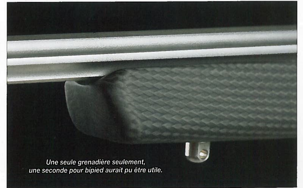
Une seule grenadière seulement, une seconde pour bipied aurait pu être utile.