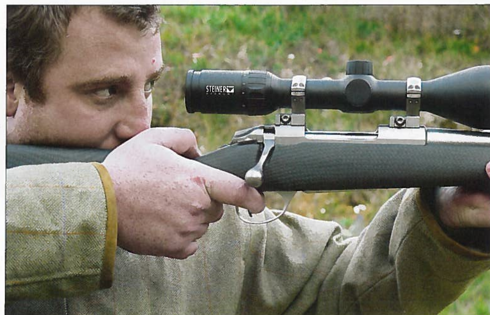
L'aspect tissé du carbone apporte un fini original à cette crosse noire.

Au tir, la douceur des calibres proposés permet de pallier les 2,4 kg de cette carabine : le recul est très modéré.