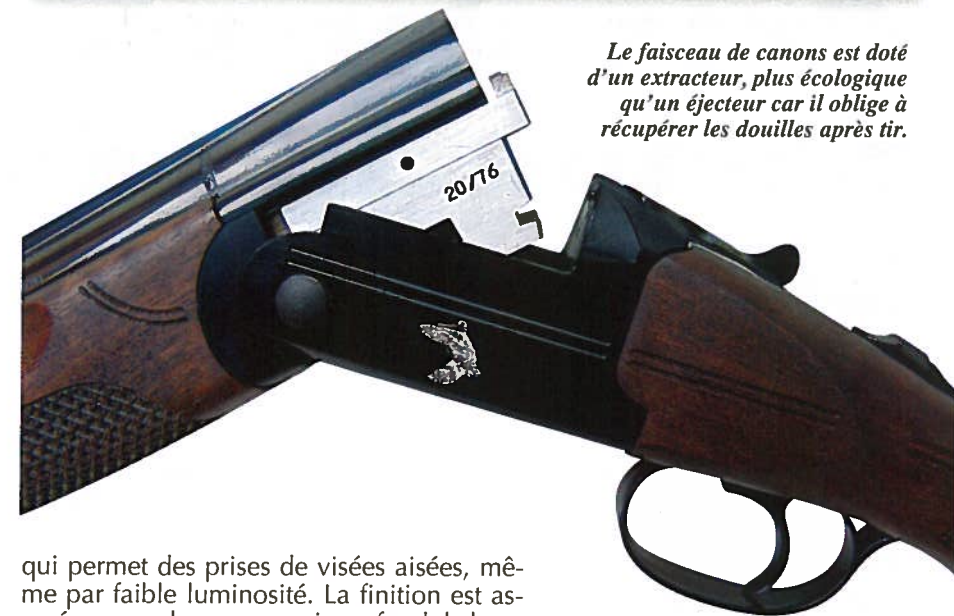
Le faisceau de canons est doté d'un extracteur, plus écologique qu'un éjecteur car il oblige à récupérer les douilles après tir.

Le Franchi Feeling Bécassier a extrait toutes les douilles sans aucun problème. Les tests réalisés avec les différents niveaux de chokes livrés avec l'arme nous ont permis de constater que les gerbes produites sont régulières et bien fournies aux distances usuelles de tir normales considérées pour ce type d'arme de chasse.