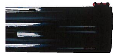
La bande de liaison se réduit à une calle de 8,2 cm afin d'optimiser le poids de l'arme au maximum.

main. Une large zone de quadrillage au motif tissé du même type que celui de la poignée pistolet assure une prise en main parfaite. La zone de quadrillage vient largement en retour sur le plat de la longuesse, ce qui, en plus de l'aspect esthétique, contribue à une tenue exemplaire. Le logo Franchi taillé dans la masse du bois est présent en fond creux sur l'avant de chaque face de la longuesse. La pièce de bois de la longuesse est reliée au faisceau de canon par l'intermédiaire d'un devant métallique qui supporte un verrou à pompe partiellement dissimulé à l'intérieur du plat. La finition adoptée, tout comme pour la crosse, est un poncé huilé naturel. Le bois est ajusté de manière parfaite avec le devant métallique qui raccorde l'ensemble au faisceau de canons.