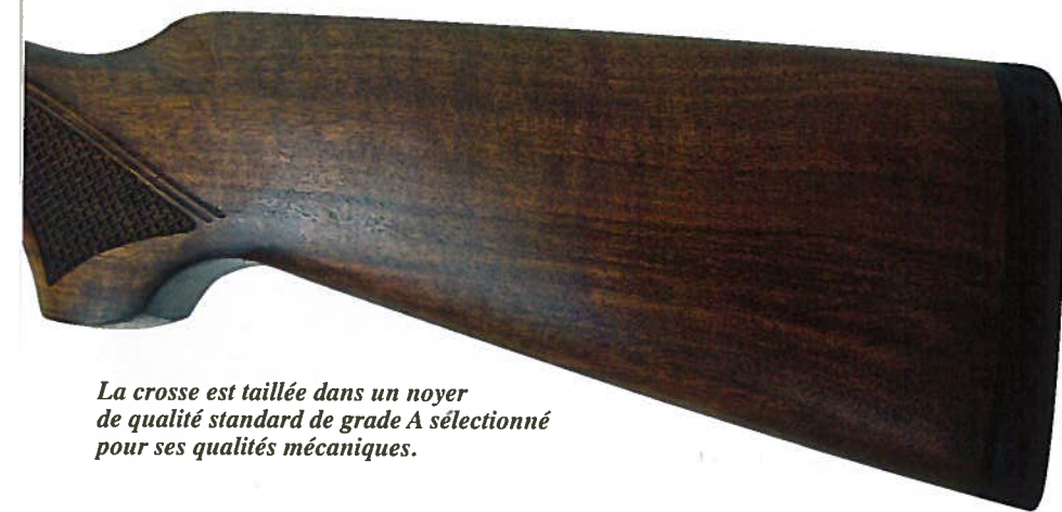
La crosse est taillée dans un noyer de qualité standard de grade A sélectionné pour ses qualités mécaniques.