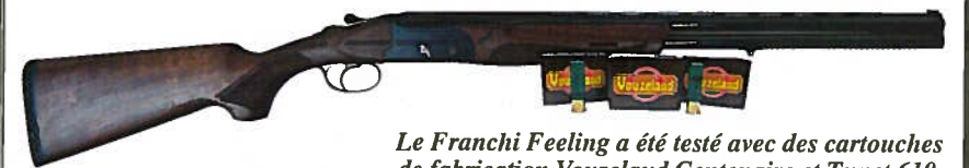
Le Franchi Feeling a été testé avec des cartouches de fabrication Vouzelaud Centenaire et Tunet 610.

Pour tester le Franchi Feeling Bécassier, nous disposons de cartouches de marque Vouzelaud chargées et commercialisées par la société du même nom. Le chargement dont nous disposons est baptisé centenaire qui est en quelque sorte un retour aux sources. En effet, il s'agit d'une cartouche au chargement spécifique 20/70 mm avec un tube en carton donc biodégradable, une bourre de type grasse, une charge de 28,00 grammes, avec pour numéros de plombs disponibles : 5, 6, 7, 8 et 9 durci.