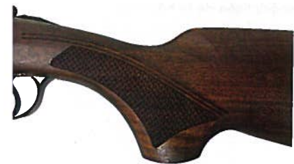
La technologie laser permet certaines fantaisies au niveau de la décoration, le quadrillage de crosse en bénéficie pleinement avec un motif tissage à trame croisée large.