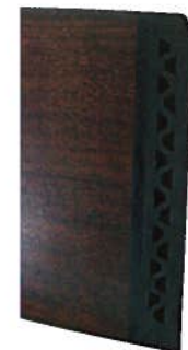
La plaque de couche est en caoutchouc alvéolé afin d'amoindrir efficacement les effets du recul qui est déjà très largement supportable avec un calibre 20.