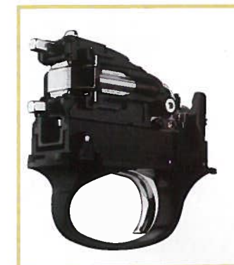
La batterie, bloc détente et percussion du 828U, pour un nettoyage aisé.

rouillage se fait par un piston. Le devant-fer est en acier. Les bois grade 3+ pour le 828U Silver et grade 3 pour le 828U Black sont poncés huilés, la finition est d'excellent niveau. Supérieure à celle de nombreux concurrents y compris au sein du même groupe.