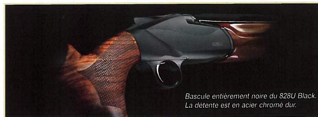
Bascule entièrement noire du 828U Black. La détente est en acier chromé dur.