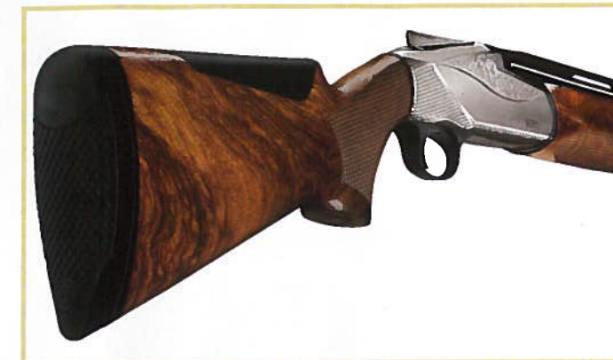
Design moderne inspiré des concept-guns, image de marque de Benelli.