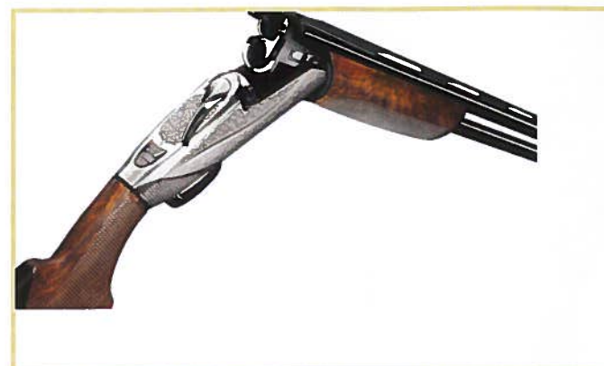
Le Benelli 828U Silver: on remarque le bloc de verrouillage oscillant.