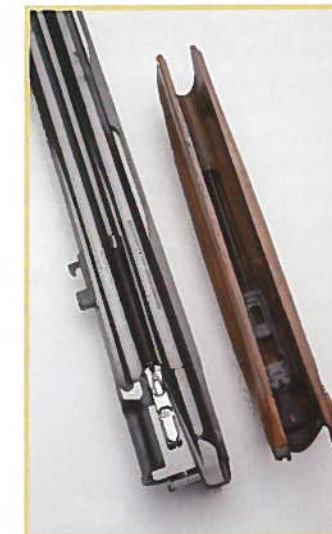
La longueur retirée on remarque le système d'éjecteurs à impulsion du 828U.