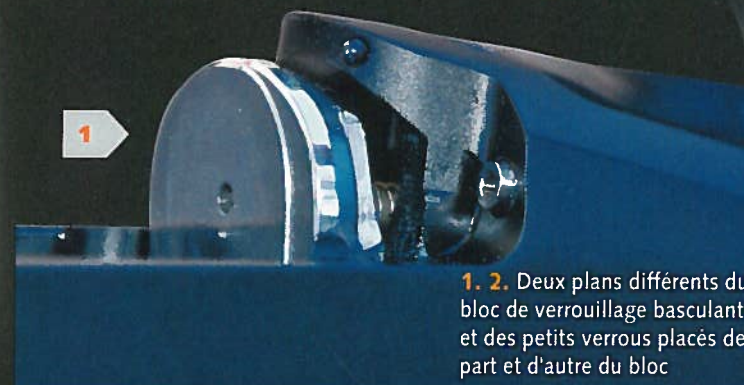
1. 2. Deux plans différents du bloc de verrouillage basculant et des petits verrous placés de part et d'autre du bloc