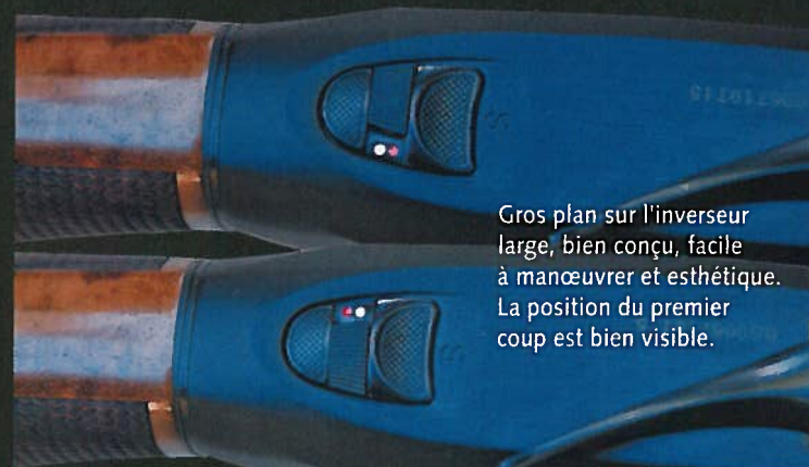
Gros plan sur l'inverseur large, bien conçu, facile à manœuvrer et esthétique. La position du premier coup est bien visible.