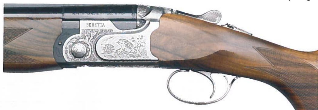
...dérivée de celle du 692 Sporting

En acier Excelsior à haute résistance, ils bénéficient de la technologie Steelium et sont chambrés pour les cartouches de 76 mm. La technologie Steelium Plus reste réservée aux fusils de sport DT11 et 692. Sur le 690, les canons Steelium ont été optimisés pour la meilleure précision,