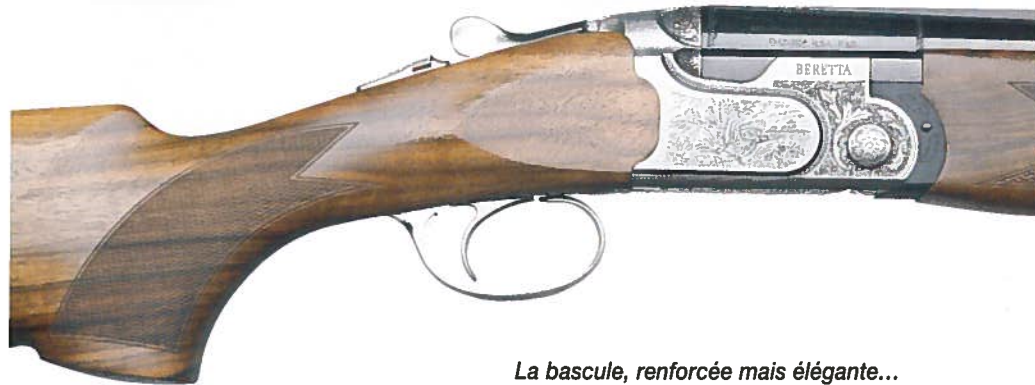
La bascule, renforcée mais élégante...

Le 690 Field III : alliance du moderne et du classique.